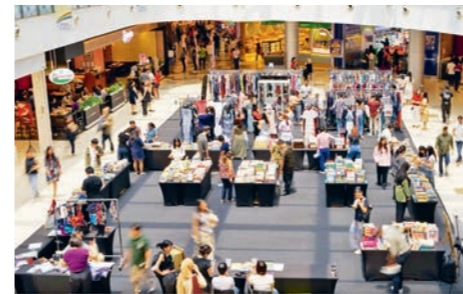
下图：在亚历山大零售中心举办为期三天的环保快闪活动，旨在推广可持续时尚和物品再利用理念。

收集了超过250件捐赠衣物。捐赠者可以选择兑换商店积分，或将所捐物品的现金价值捐给新加坡自然协会，同时访客还可以购买二手服饰。