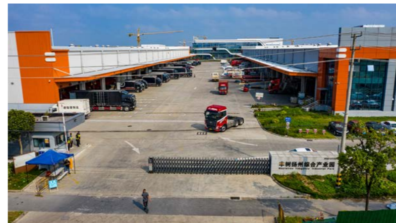
上图：位于江苏省扬州市的丰树扬州综合产业园包括四栋单层仓库，净可租赁面积超过83000平方米。