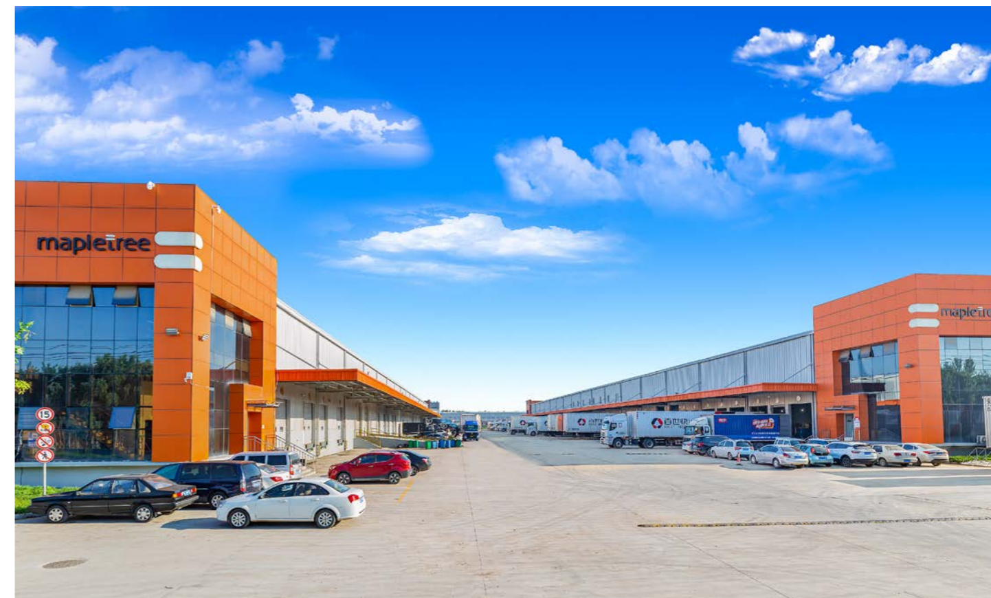
上图：丰树积极主动地维护与客户的关系，为客户打造量身定制的解决方案，以支持他们在不断变化的市场中提升运营效率，满足消费者需求。