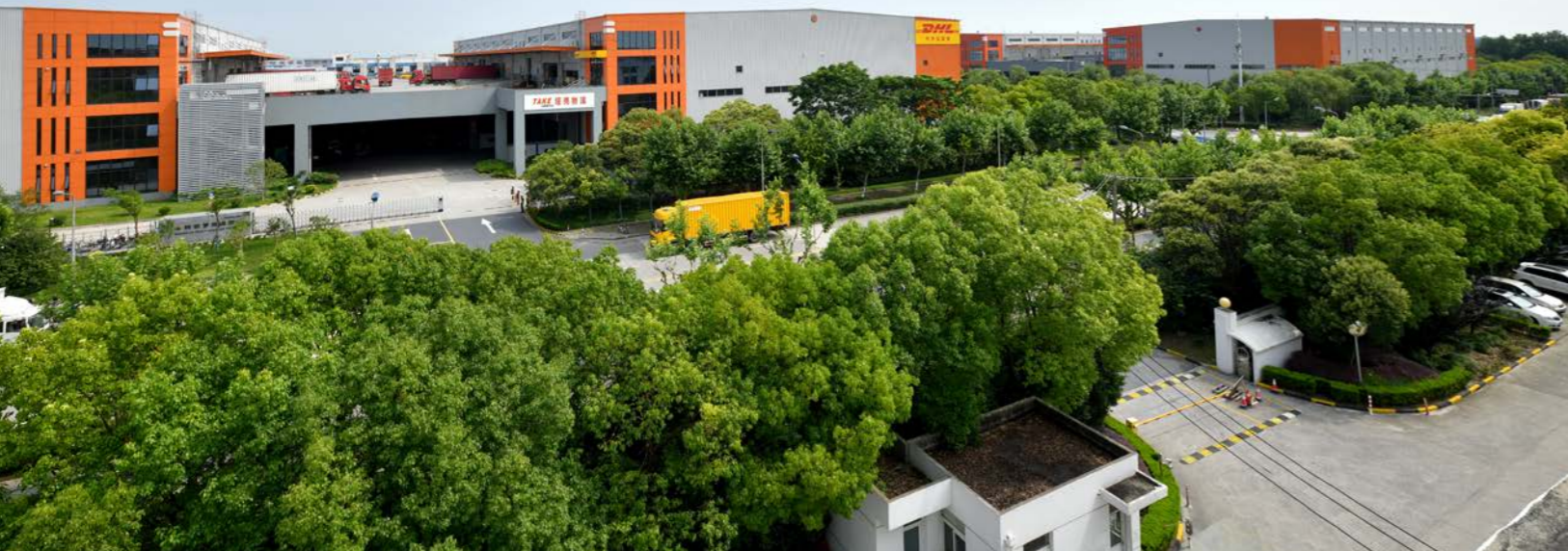
上图：丰树位于中国内地的首项物流资产——丰树欧罗物流园区临近上海浦东国际机场，地理位置优越。