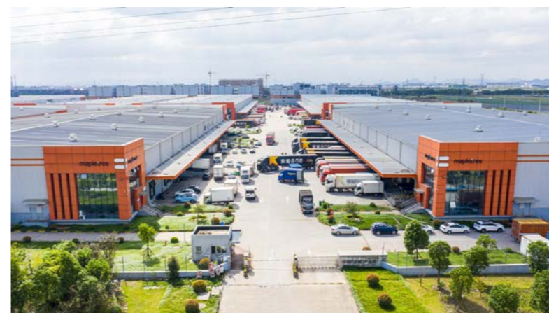
上图：丰树与诸多全球和本地物流企业有着长期和广泛的合作，利用我们遍及中国的优质物流设施网络，支持客户的日常运营和可持续成长。

同时，丰树旗下500多个位于全球诸多关键城市的强大物流设施网络，可以支持国际企业的全球业务，以及满足积极拓展国际市场的本土企业的需求。