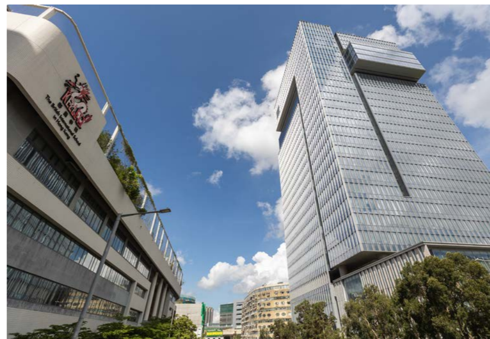
上图：啓歷学校的九龙湾校舍将通过行人天桥连接位于太豐匯的新校舍。

2025年9月3日，香港英国国际学校啓歷学校(Kellett School)与太盟投资集团及丰树集团签订租务协议，承租两者合资持有的九龙湾甲级写字楼项目——太豐匯两层基座商铺，以扩展现有九龙湾校舍，锐意发展更多元化及充满活力的教育环境。本次交易为香港2025年以来第三大商铺租务成交。