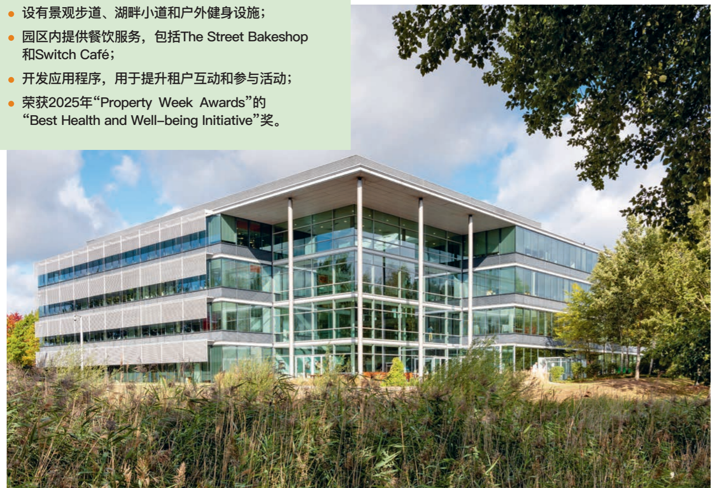
上图：Green Park的100 Longwater Avenue提供设施齐全的优质办公空间，包括具有一流会议设施的商务中心、咖啡馆和自行车骑行者淋浴间。

这些举措的成功凸显了当今市场对办公楼评估方式的广泛变化。越来越多的企业不仅仅通过面积或租赁条款来衡量价值，还包括工作场所质量、社区建设和人文关怀。Green Park对这些领域的重视满足了租户不断变化的需求，并因此获得了业界认可，如2025年“Property Week Awards”的“Best Health and Well-being Initiative”奖。