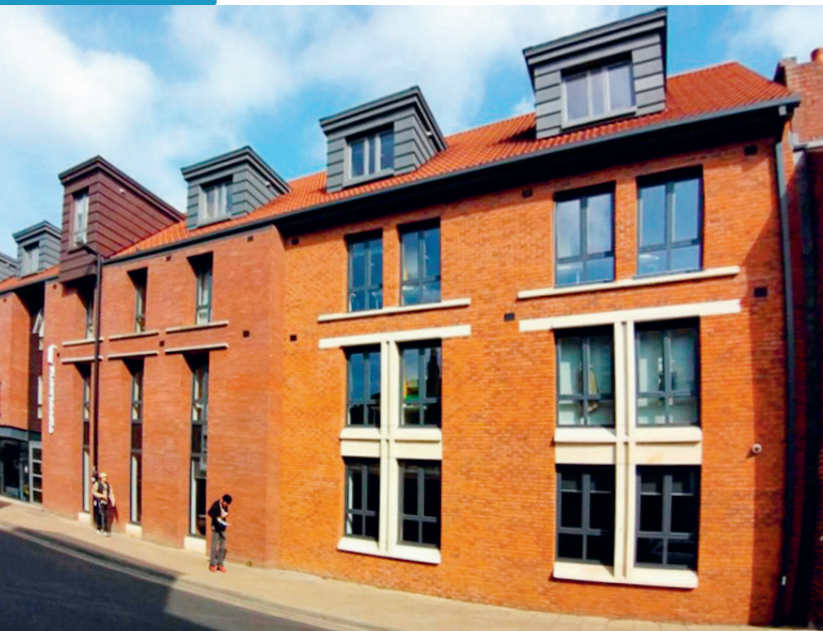
上图：Student Castle York是一栋拥有661个床位的优质学生住宿物业，位于该市历史中心地带。