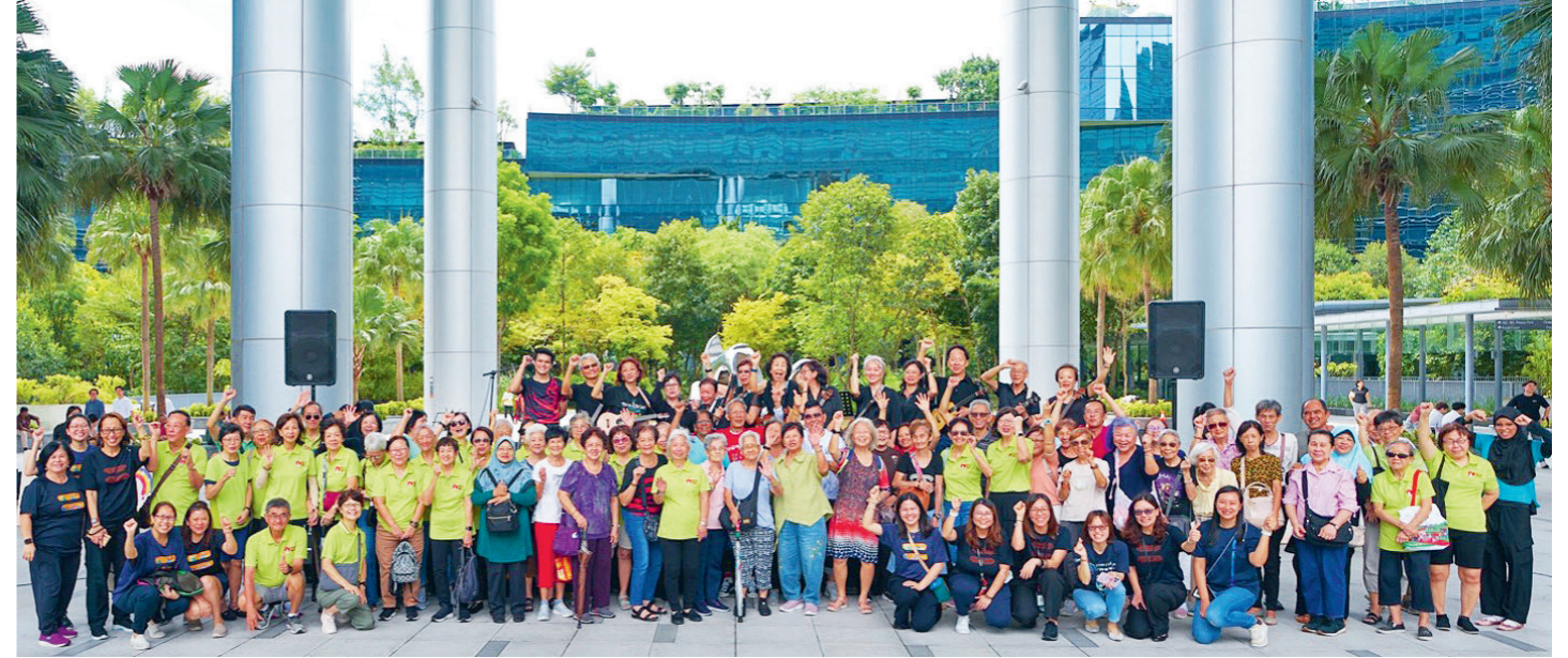
上图：2025年8月13日，来自新加坡职总保健乐龄活动中心（直落布兰雅）和安息日会活跃中心（Golden Clover）的60名乐龄人士参观丰树商业城，参与互动式数字识字游戏工作坊并欣赏“丰树艺术城系列”之友谊篇章演出。

为了提升视觉艺术，来自新加坡城市写生人（Urban Sketchers Singapore），以及马来西亚、澳大利亚和中国的90多名速写者，聚集在历史悠久的圣占姆士发电厂，用绘画描绘其工业魅力。