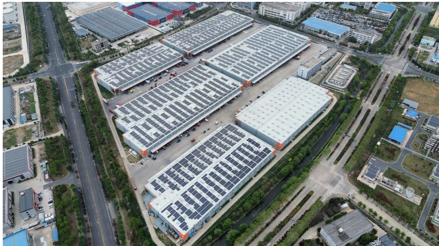
上图：丰树巢湖现代综合产业园

为达成“2050年实现净零排放”的目标，丰树在2022年制定了详尽的净零排放路线图作为指导性框架，包括以可持续发展为导向的改进举措、可再生能源的装置与采购，以及绿色建筑认证等方式提升资产的韧性。经过三年的努力，丰树中国在可再生能源的安装、绿色建筑认证和植树这些领域达成或提前实现既定目标。