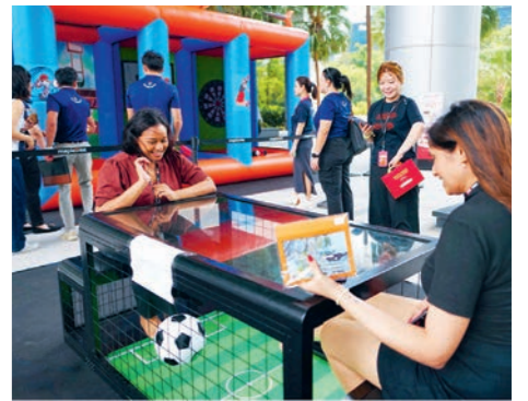
上图：2025年8月27日至28日，“丰树慈善体育嘉年华”在亚历山大社区举办为期两天的活动，为慈善事业和本地年轻艺术家筹款。

两项活动筹得的所有款项均捐赠给“儿童城”和“彼岸社会服务”两家慈善机构，同时也向参与明信片创作的艺术家支付版权费用。