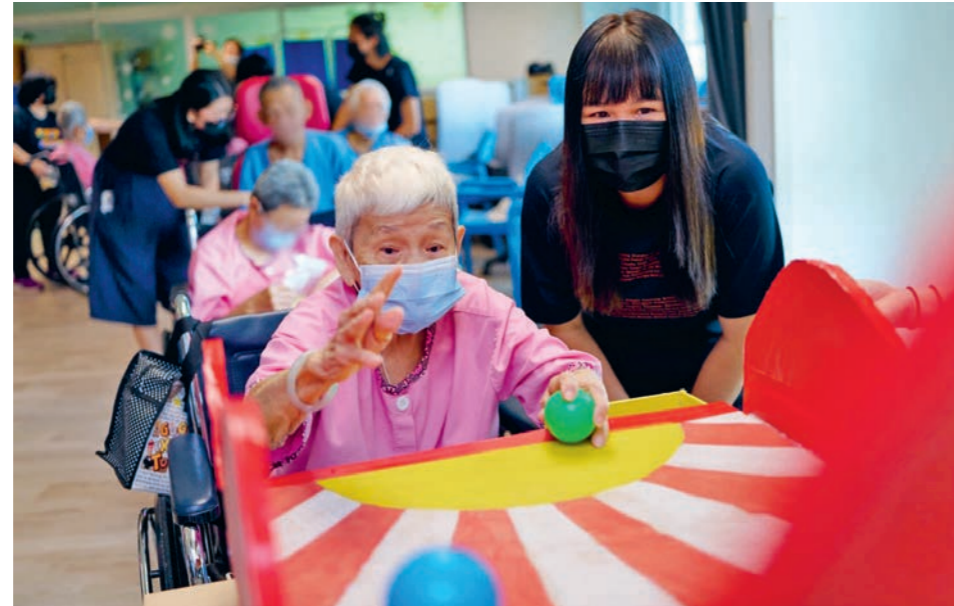
上图：2025年7月31日和8月7日，丰树员工志愿者分别与圣安德烈疗养院（亨德申）的71位乐龄人士一同欢庆新加坡建国60周年。