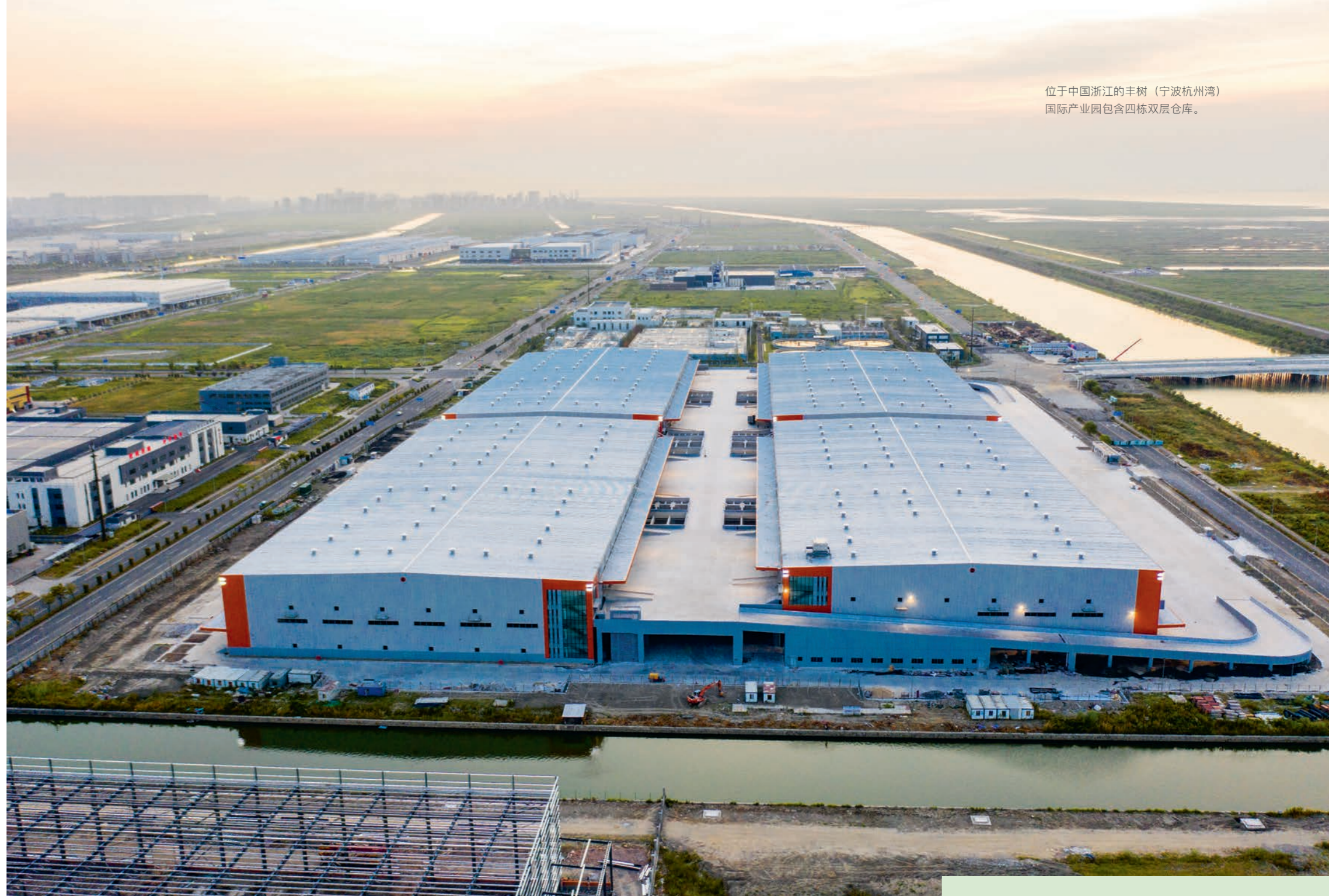
位于中国浙江的丰树(宁波杭州湾)国际产业园包含四栋双层仓库。