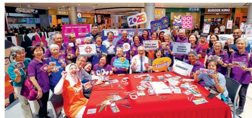
上图：丰树与慈善机构福善 合作，邀请乐龄人士制作妆 艺主题手工纸质钱包，助力 新加坡与马来西亚联合为妆 艺大游行申报联合国教科文 组织非物质文化遗产。

此外，丰树与本地慈善机构福善合作，邀请乐龄人士 制作了500个妆艺主题手工纸质钱包，并在宣传期间 分发给访客。