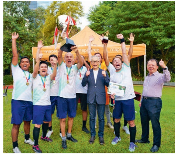
上图：包括2025年冠军队法国东方汇理银行（如图）在内的16支队伍，于2025年8月21日和28日在丰树商业城五人制足球场，参与为期两天的“2025年丰树五人制足球挑战赛（公开组）”。