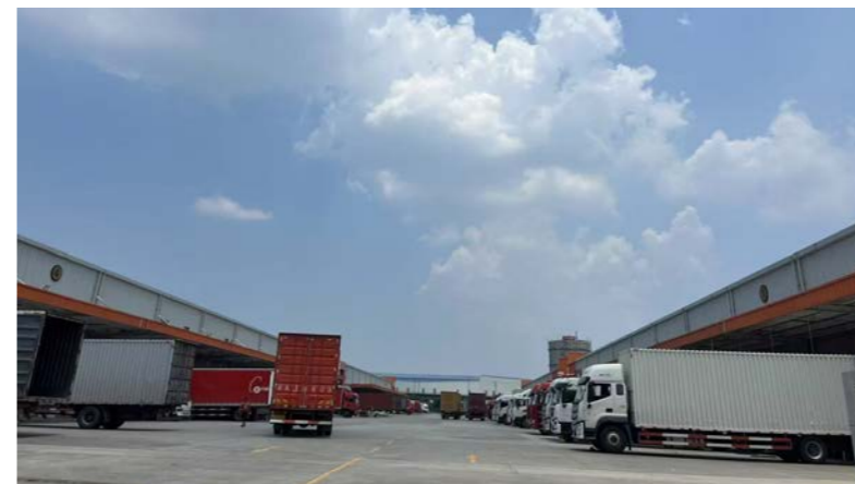
上图：基于多年累积的开发专长和经验，丰树为中国市场提供了优质、高效且具备可持续性能的物流仓储设施。