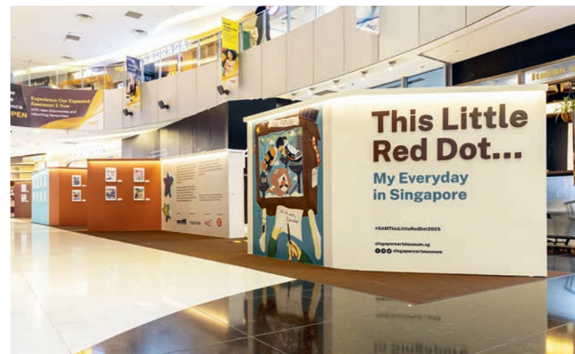
下图：新加坡家庭在“小红点……”展览上发现新加坡故事。