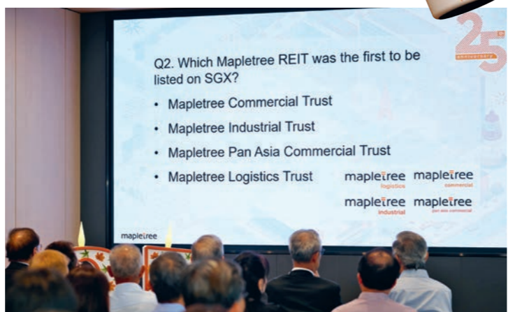
上图：参会者踊跃参与趣味知识问答，共同回顾丰树25年的发展历程。