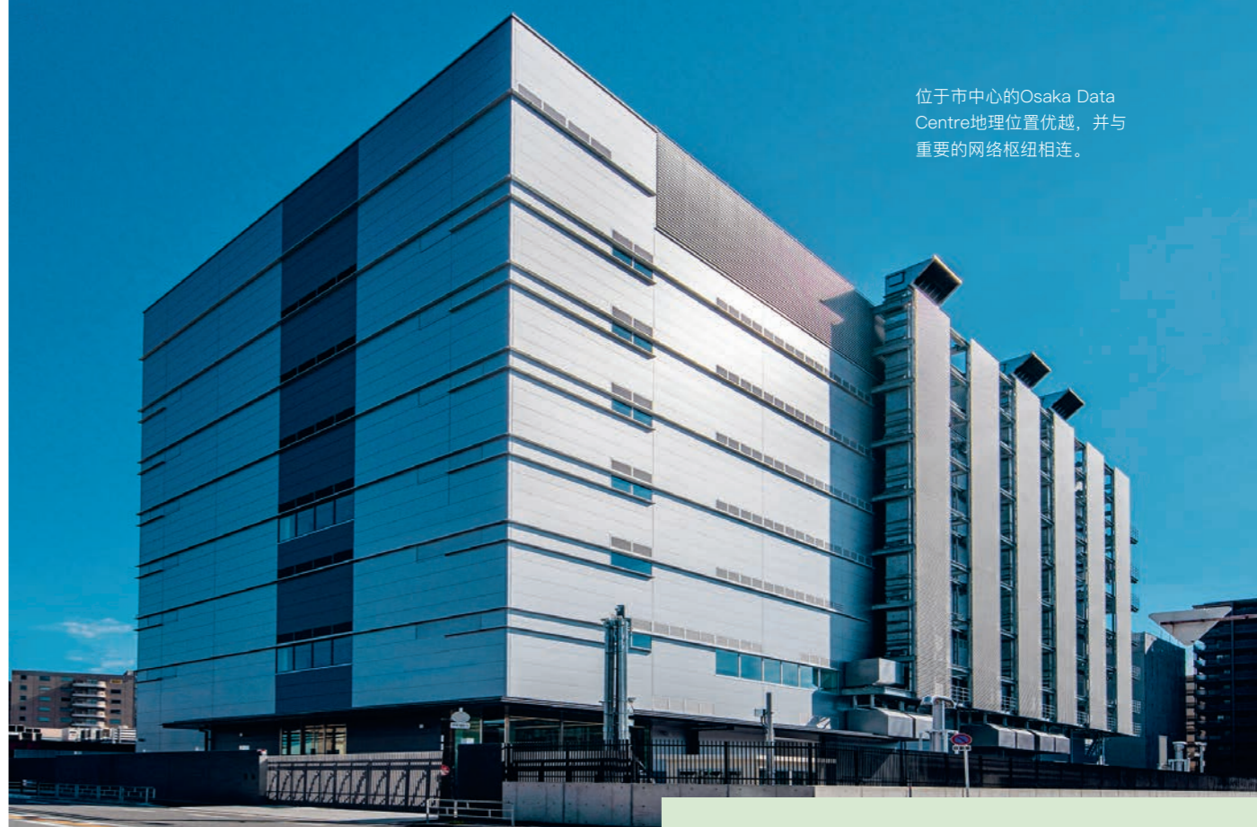
位于市中心的Osaka Data Centre地理位置优越，并与重要的网络枢纽相连。