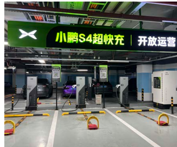
上图：位于广州铭丰广场的超快速电动汽车充电站为大厦的租户提供了便利。

作为在中国市场率先为旗下物流物业申请LEED认证的房地产公司，在2025年5月接受《中国日报》采访时，丰树中国区首席执行官吴财文先生介绍了丰树中国在可持续发展旅程上已经取得的成就，并表示：“我们的目标是到2030年为中国物流资产安装超过180兆瓦太阳能光伏系统，到2035年实现中国物流和商业资产100%获得绿色建筑认证。”