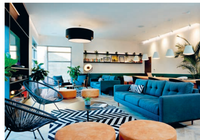
上图：Student Castle Oxford提供现代化的学生住宿空间，拥有多种房型和设施，包括宽敞的公共区域、自习休息室和健身房。

Green Park的关键创新之一是推出Flexible Space @ Green Park模式，即提供一个设施齐全和全套服务的办公空间，为寻求灵活和便利的租户提供现成可用的单位。这些空间为全包租赁模式，涵盖商业税费、服务费、互联网和水电费，并提供一至三年的短租条款。该模式满足了各类企业的需求，包括初创企业与运营多年的企业，其中就有IT咨询和采购公司Akoni Technologies，以及跨国软件公司IGEL Technology。