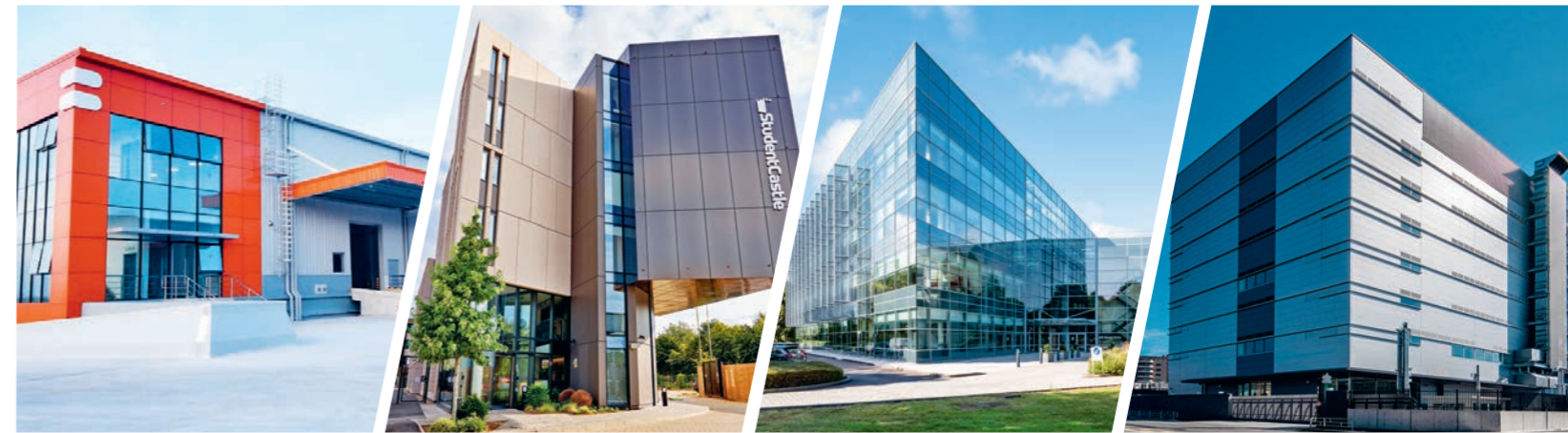
上图：(从左到右) 丰树(宁波杭州湾)国际产业园(中国浙江)；Student Castle Oxford(英国)；100 Brook Drive, Green Park(英国)；Osaka Data Centre(日本)。

丰树认识到，租户的期望正在提升，寻求的已不仅仅是物理空间，更是综合解决方案。因而，我们正在调整策略，以满足这些不断变化的需求。