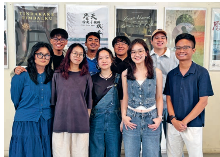
上图：入选丰树青年电影制作人计划的拉萨尔艺术 学院电影学士(荣誉)专业学生。

拉萨尔艺术学院与南洋艺术学院的学生及教职员工将共同参 与这些项目的开发，两校导师将指导创作过程，并监督最终成 果的呈现。