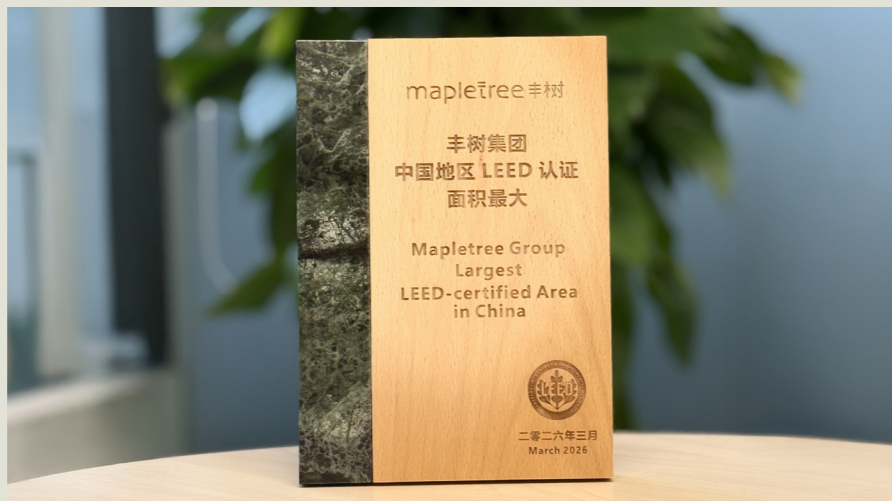
▲ 丰树荣获“中国地区LEED认证面积最大”荣誉奖牌。

根据USGBC的统计，截至2026年3月底，丰树在中国拥有近500个LEED认证项目，LEED认证总面积近1000万平方米，成为中国LEED认证面积最大的企业。