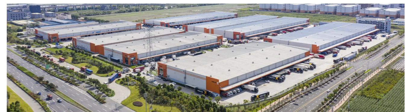
▲ 丰树（余姚）产业园一期和二期拥有八栋单层仓库，地处长江三角洲两大主要城市宁波和杭州之间，并连接多条高速公路。

在专业机构观点发布的“卓越指数·2025产业暨物流卓越表现”研究成果中，丰树荣幸入选“2025物流仓储资产投资运营卓越表现10”，这也是丰树连续第三年入围此榜单，并荣登第六位。