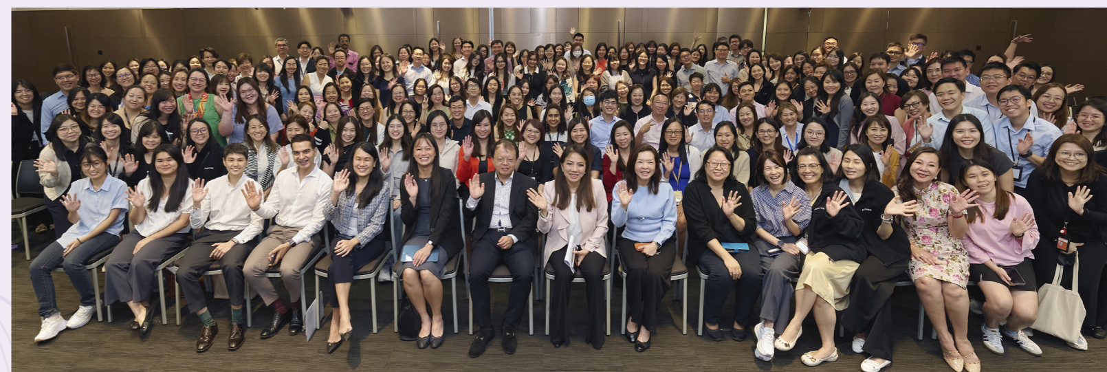
▼ 在丰树商业城举办的分享会吸引了200名丰树租户、员工和高等学府学生参与。

陈女士说:“这是一种取舍,自己必须清楚什么才算重要,什么应该放手。”她表示,她在孩子年幼时尽量减少海外出差,并且在重要的时刻陪伴孩子左右。