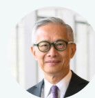
郑维荣先生 丰树集团主席

作为致力于可持续发展的房地产开发商，丰树坚信负责任实践可以为城市发展创造长期价值。