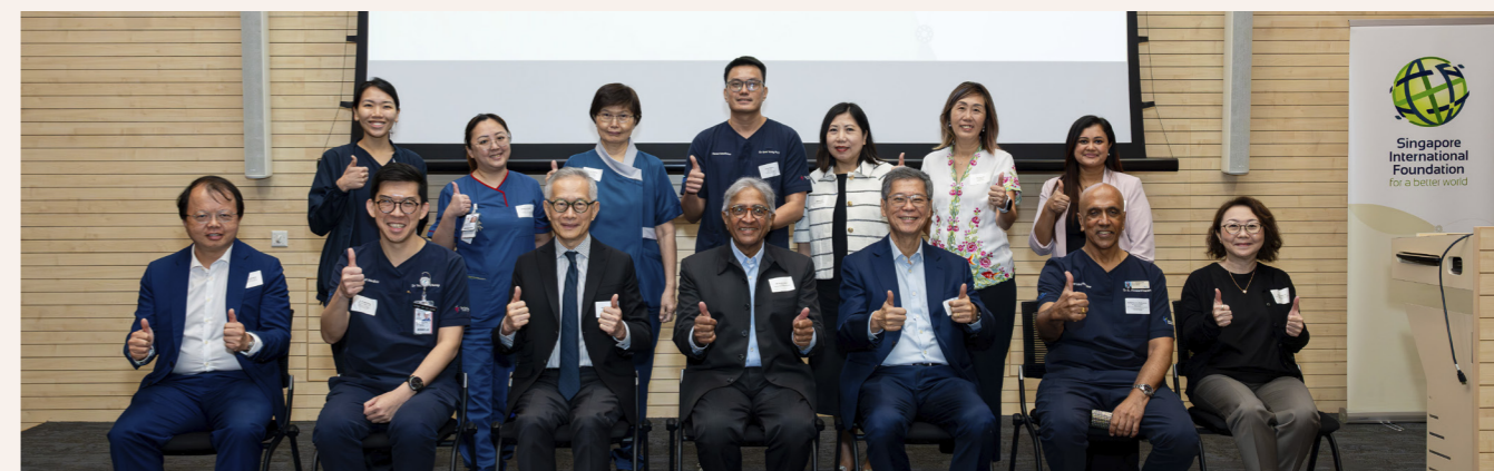
▲ 丰树社区影响计划表彰仪式于2025年11月14日在陈笃生医院举行，来自新加坡国际基金会、丰树产业和新加坡国际志愿团队的代表出席了仪式。

在丰树社区影响计划的支持下，PACT和THAN计划预计将惠及超过47000名病患、医疗保健人员和医科学生。